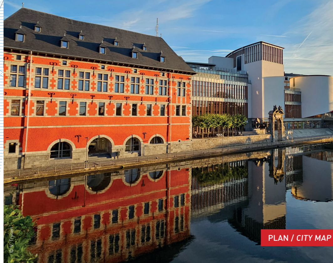
PLAN / CITY MAP